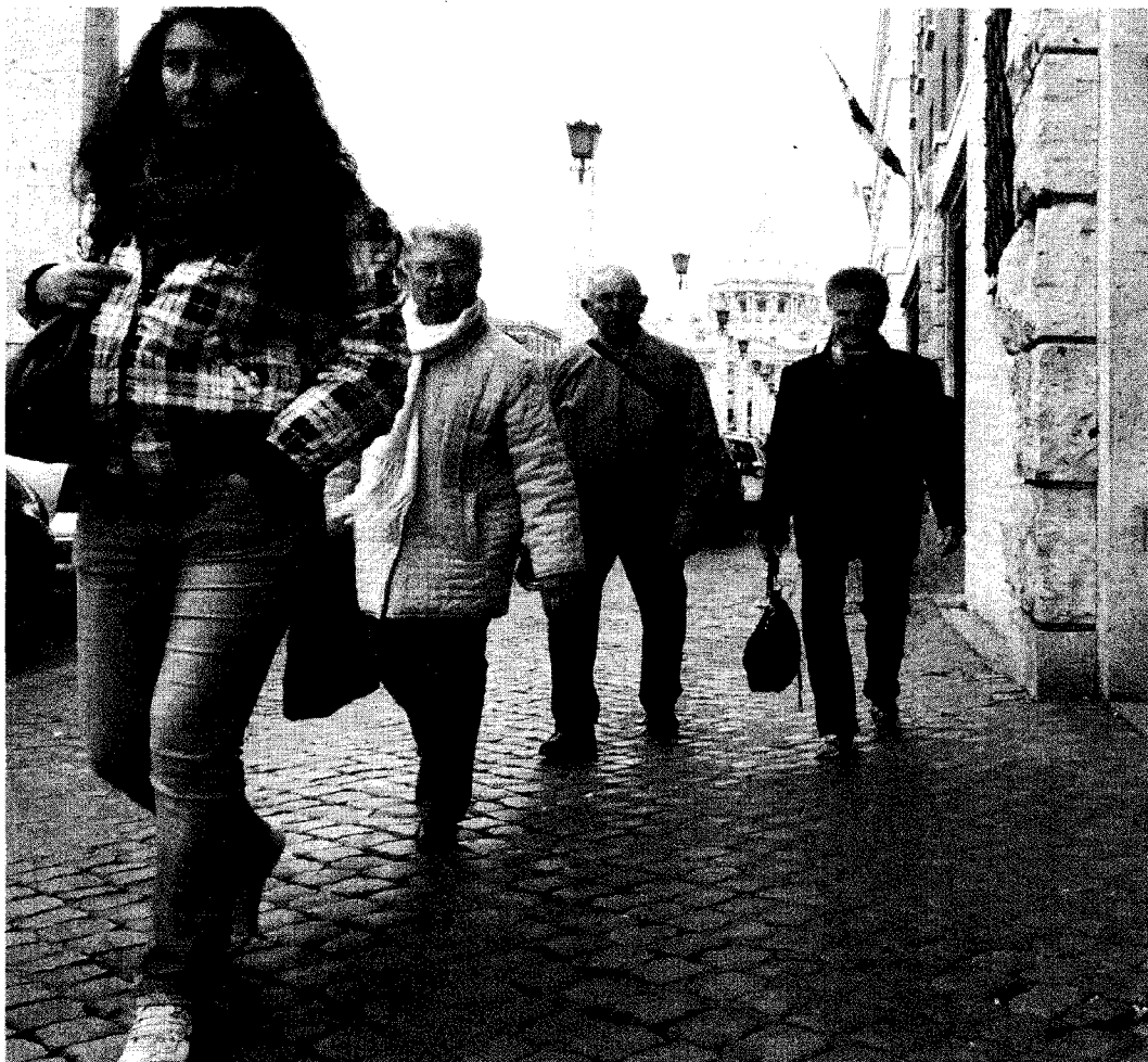
Una grande foto di Papa Giovanni Paolo II campeggia in Via della Conciliazione a Roma

2 Privilegi speciali furono concessi direttamente da Papa Giovanni Paolo II a padre Maciel, noto per la sua straordinaria capacità di far affluire denaro nelle casse della Chiesa e per aver abusato sessualmente più di 20 suoi seminaristi. Anche dopo che questi fatti furono resi noti, Giovanni Paolo II continuò ad appoggiare la persona e la sua congregazione, i Legionari di Cristo, continuando a ordinare decine di preti